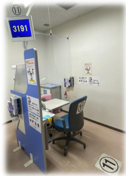
11 番採血台に「3191」番の患者さんが表示されている