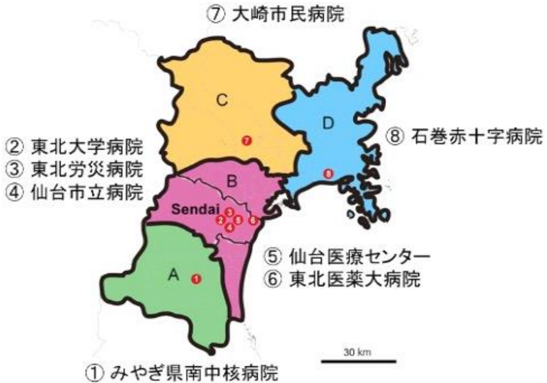
図 1. 調査対象病院 宮城県全域の 8 つの基幹病院を対象とした。