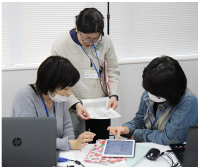
昨年の研修の様子(タブレット端末を使って RASECC-GM の使い方を学ぶ)