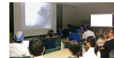
多診療科・多職種カンファレンス